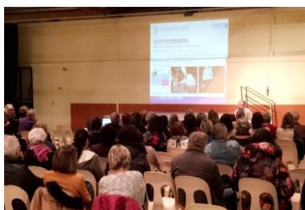
Photo de la conférence débat.