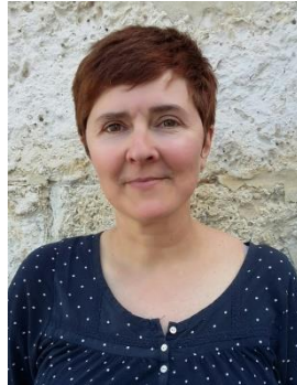
Notre nouvelle chargée de mission

Nous lui souhaitons la bienvenue dans ses nouvelles fonctions.