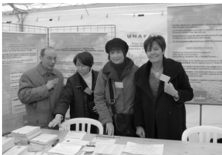
Notre stand sous le Chapiteau Place Bellecour

Le 25 mars a été inauguré à Saint-Cyr-au-Mont-d'Or, le foyer d'accueil médicalisé « les Carbones ». Etablissement organisé autour de 5 unités de vie regroupant au total 50 chambres. Ce foyer d'accueil est destiné à recevoir les personnes lourdement handicapées, souffrant de dépendance totale ou partielle, inaptes à toute activité professionnelle.